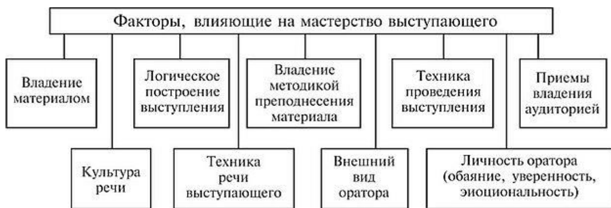
Рис. 2.2 Факторы, влияющие на мастерство выступающего

Мастерство выступающего (ораторское искусство) — это совокупность операций по подготовке и произнесению публичной речи, проведению беседы, дискуссии с целью добиться желаемой реакции аудитории. Знание правил и обладание навыками риторики, т. е. теории построения, подготовки и доведения до слушателей выступления в различных формах, позволяют смоделировать его ход, спрогнозировать возможную реакцию слушателей, а также определить способы использования стилистических форм повышения выразительности речи, основных правил культуры дискуссии.