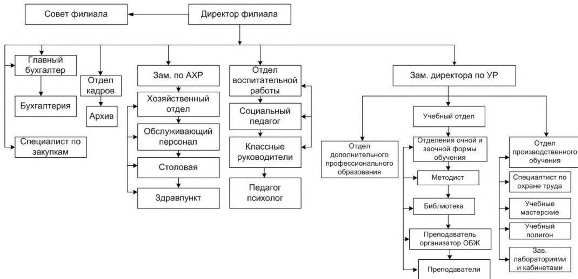
Таблица 1. Структура Калужского филиала ПГУПС