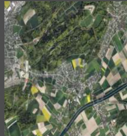
Коммуна Орпунд (Готтштадт)