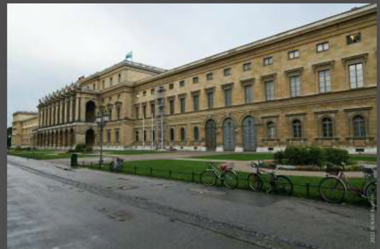
Баварская Академия Наук (Бавария . Германия)