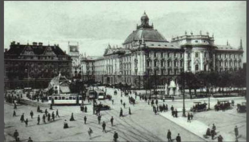
Мюнхен, Германия (город в котором Ом получил признание от всех физиков Германии и прожил свою жизнь)