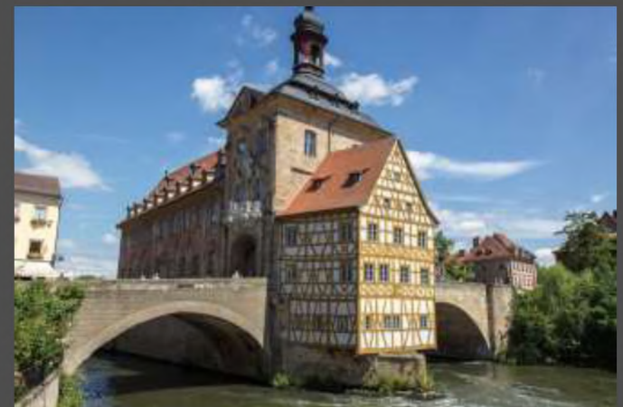
Бамберг. Мюнхен (Германия)