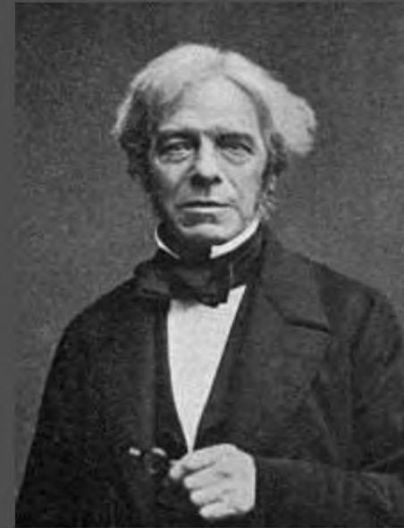
Майкл Фарадей Физик