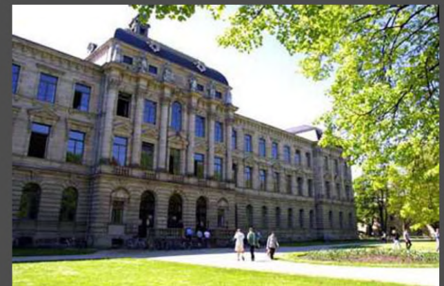
Университет имени Фридриха — Александра в Эрлагене и Нюрнберге