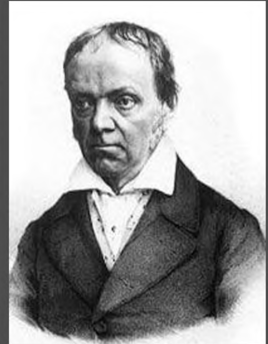
Брат Георга – Мартин Ом (знаменитый математик)