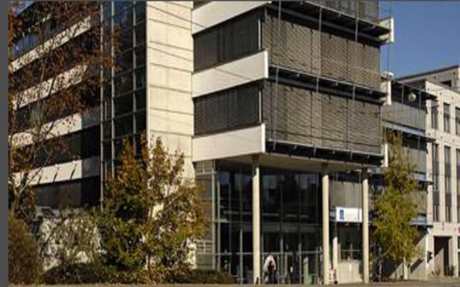
Университет им.Георга Ома