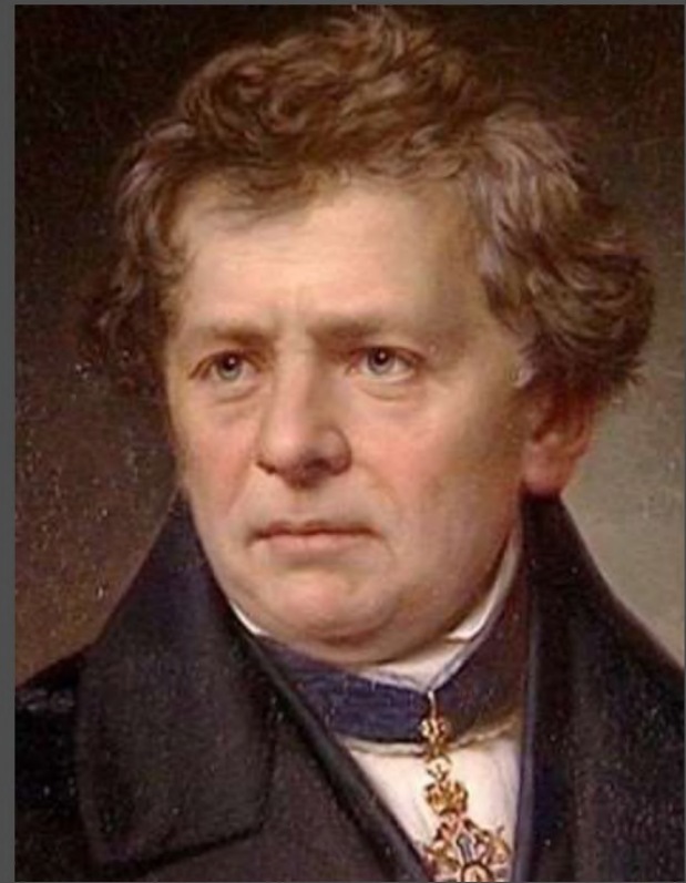
Георг Симон Ом