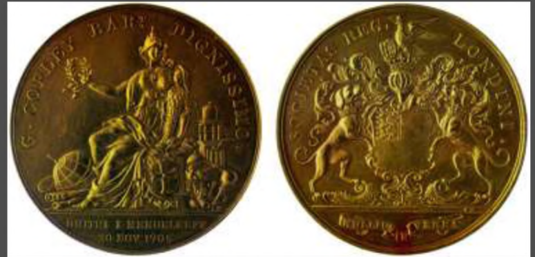
Медаль Копли — высшая награда Королевского общества Великобритании