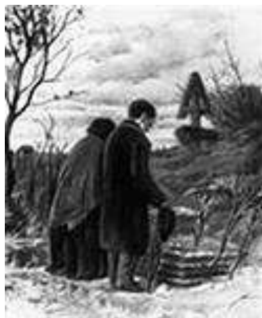
В. Перов. Старики родители на могиле сына.