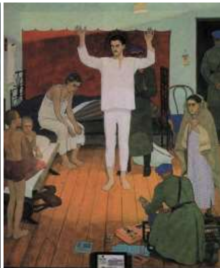
В. Комар, А. Выучите Мелвмид. Происхождение соц.реализма.