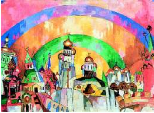
Арисларх Лентулов. Небосвод.