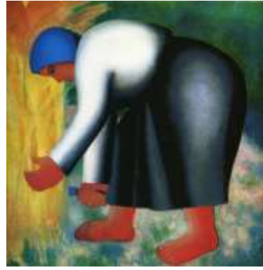
Казимир Малевич. Жница.

Имажинизм: Основателем был Сергей Есенин.