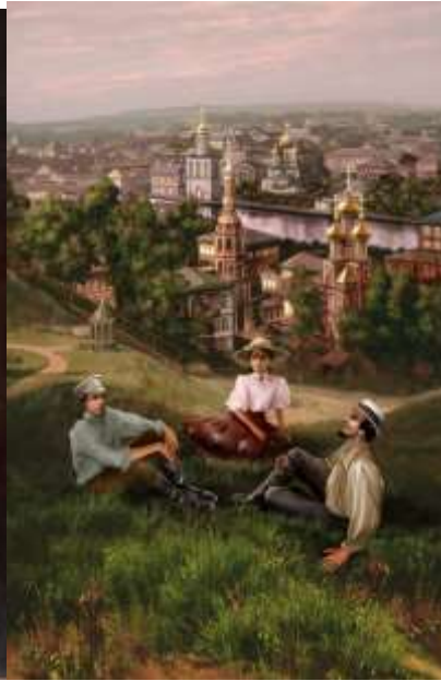
Иллюстрации Натальи Ершовой.