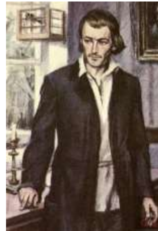
Базаров. Худ. Боровский.