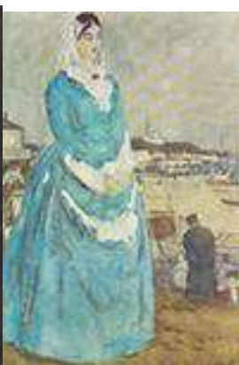
Сергей Васильевич Герасимов . Катерина.