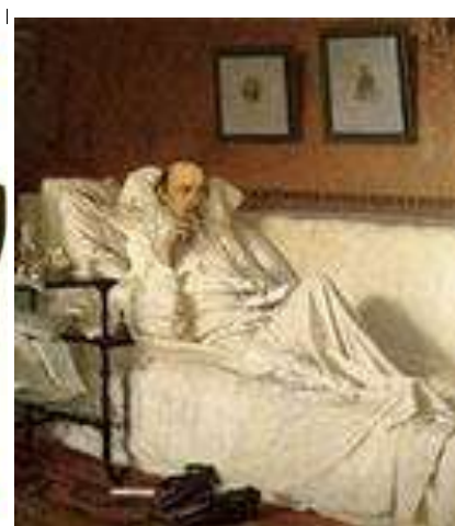
И.Н. Крамской. Некрасов в период