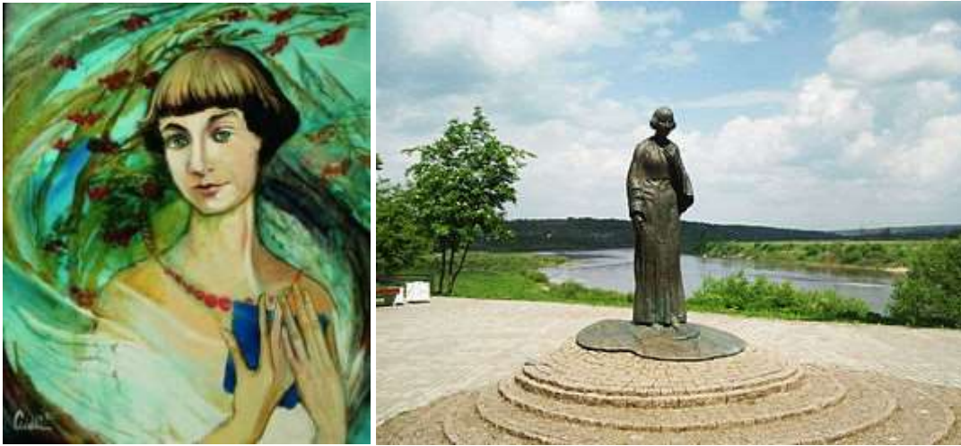
Памятник Марине Цветаевой в Тарусе. Борис Мессерёр.