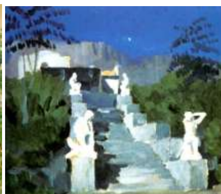
Михаил Врубель Виктор Борисов-Мусатов. Весна.