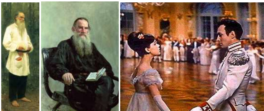
И.Е. Репин. Портрет Л.Н. Толстого.

ТОЛСТОЙ Лев Николаевич [28 августа (9 сентября) 1828, усадьба Ясная Поляна Тульской губернии — 7 (20) ноября 1910, станция Астапово (ныне станция Лев Толстой) Рязано-Уральской ж. д.; похоронен в Ясной Поляне], граф, русский писатель.