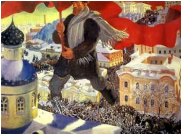
Борис Кустодиев. Большевик. 1919-1920 г.