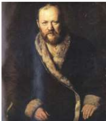
Василий Перов. Портрет А.Н.Островского.

Александр Николаевич Островский (1823, Москва, район Замоскворечья – 1886, имение Щельково Костромской губернии)- выдающийся драматург, автор 47 оригинальных пьес.