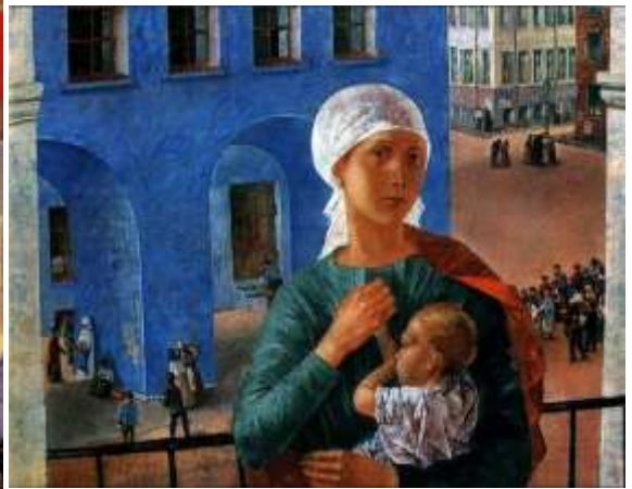
Кузьма Петров-Водкин. 1918 год