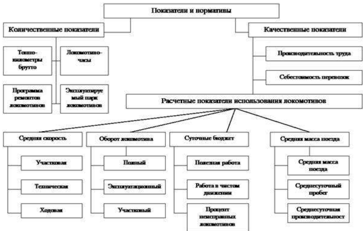
Рисунок 2 – показатели использования локомотивов

Для выполнения функций управления комплексом предприятий железнодорожного транспорта разработана и используется система показателей, норм и оценок деятельности линейных предприятий железнодорожного транспорта. Часть показателей разрабатывается с учетом долговременных экономических нормативов и норм и используется при планировании работы предприятий. Большая группа показателей, полученная в результате расчетов, служит для организации контроля, оценки и анализа работы предприятий.